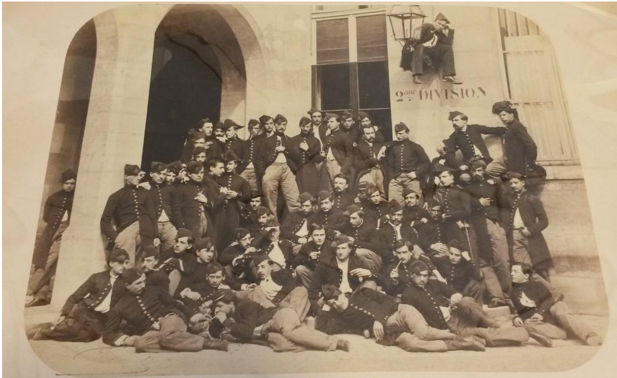
Photographie de la 2ème division. On remarquera le port de la veste de GU déboutonnée.