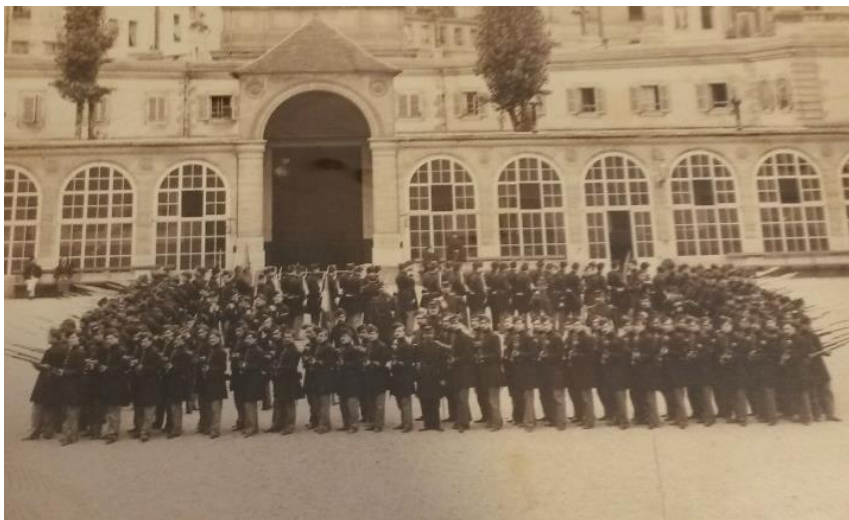
La promotion 1865 en formation dans la cour à Carva